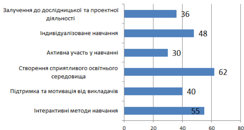
Рис. 2. Відповіді респондентів

санти відчувають підтримку від викладачів та одногрупників (62%), залучення до проектної та дослідницької діяльності, наприклад у вигляді рефератів, наукової доповіді, статті, наукової конференції, презентації, макету стимулює та мотивує їх до більш активної участі у процесі вивчення ОК «Морське право». Результати проведеного дослідження дають можливість дійти висновку, що доцільно використовувати сучасні інноваційні підходи у процесі вивчення ОК «Морське право», використовувати технічні засоби, зокрема навчальні комп'ютерні програми, програми симулятори, інтерактивні дошки, електронні видання та підручники тощо, адже вони постійно вдосконалюються, чим полегшують можливість пізнання, формування знань і вмінь, та підвищення мотивації майбутніх фахівців морської галузі.