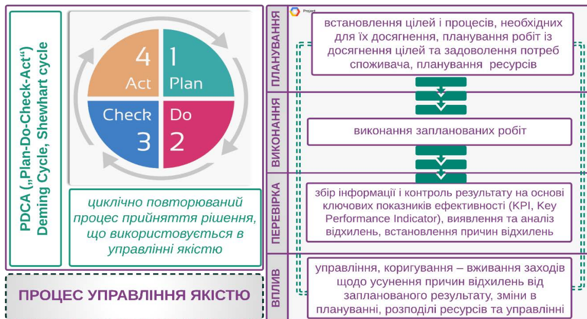
Рис. 1. Модель Шухарта-Демінга «Цикл управління якістю»