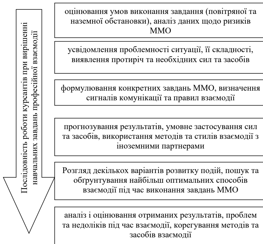
Рис. 2. Орієнтовна схема розв'язання завдань взаємодії військових пілотів з іноземними партнерами

4. Потім курсантам презентуються на розгляд заходи, які було проведено реальним екіпажем у схожій ситуації. Відбувається порівняльний аналіз пропозицій курсантів і реальних заходів під