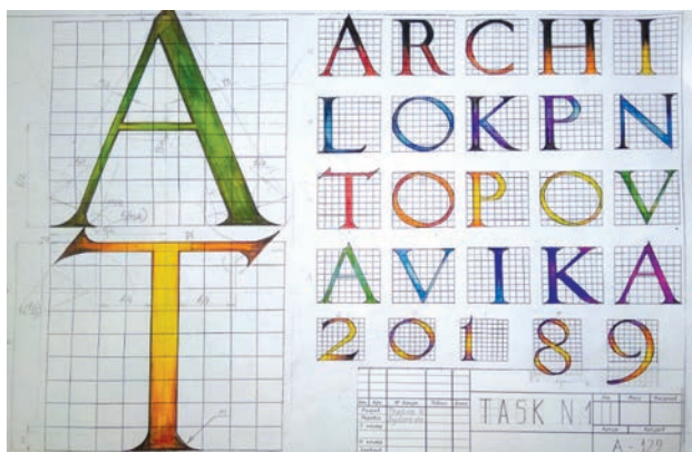
Рис. 1. Приклад виконання графічної роботи «Шрифт «Антиква»»

На практичних заняттях, які проходили щотижня в академії, студенти мали можливість виконувати завдання, які потребують безпосередньо поетапного контролю викладача [3, с. 163]. До такої графічної роботи належить виконання шрифту «Антиква». Виконувати практично цей шрифт можна після проходження теми «Спряження». Для полегшення креслення складних фрагментів букв і цифр викладачі кафедри розробили спеціальні формати. Відповідно до завдання на форматах заготовлені модульні сітки відповідного розміру й масштабу, у яких і викреслюються безпосередньо букви і цифри (рис. 1).