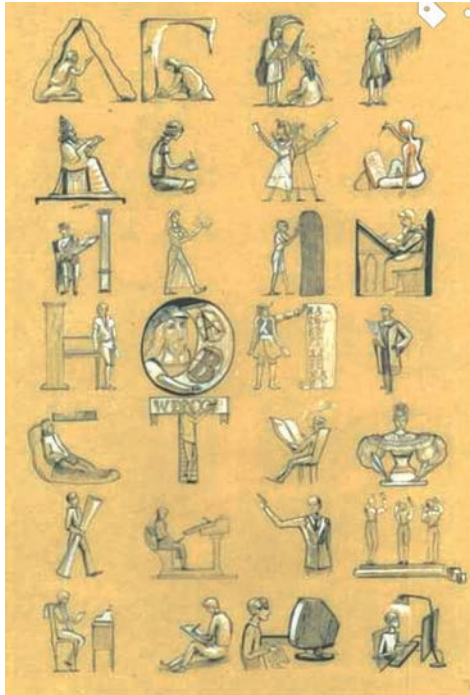
Рис. 4. Приклад викладання шрифтової композиції студенткою ОДАБА. Номінація «Декоративний алфавіт»

Студенти I курсу Архітектурно-художнього інституту ОДАБА, прослухавши курс «Мистецтво шрифту» за новою навчальною програмою, показали неперевершені результати (рис. 4).