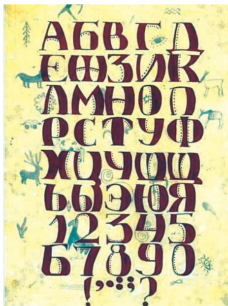
Рис. 2. Приклад викладання шрифтової композиції студенткою ОДАБА. Номінація «Декоративний алфавіт»

Однак найцікавішою графічною роботою за весь практичний курс, за опитуванням студентів, є виконання шрифтової композиції. Кожного навчального року тема шрифтової композиції та номінації виконання змінюються. Це дає можливість студентам додатково знайомитися з теоретичним матеріалом, який не входить в основу дисципліни, та грамотно використовувати шрифти різних стилів для визначення й підсилення емоційної значущості інформації, що надається під час створення об'єктів комунікацій. На практичних заняттях в академії студенти мають можливість показати успішність володіння різними прийомами та способами написання шрифту й уміння відтворювати стильову єдність шрифту за базовими елементами й літерами (рис. 2).