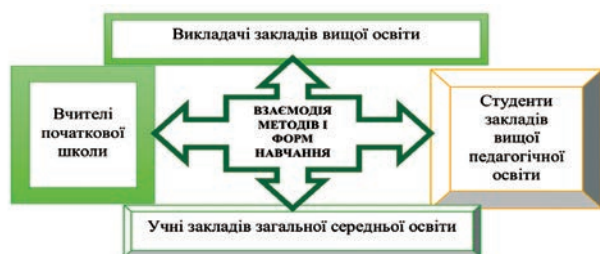
Рис. 1. Суб'єкти використання взаємодії методів і форм навчання

У низці наукових досліджень наголошено на тому, що студентів як майбутньому педагогові правове виховання потрібне не тільки як особистості, а що воно також слугує невід'ємною ознакою його фахової діяльності. Водночас упущено важливу деталь: у складному процесі правової підготовки всі методи проходять спіралеподібний цикл: вони не тільки взаємопов'язані, а й трансформуються в ланцюжку: науковець – підвищення фаху педагога вищої школи – застосування методу викладачами ЗВО у вихованні студентів – застосування методу студентами під час навчання, педагогічної практики й у майбутній фаховій діяльності, щоби впливати на учнів (рис. 1).