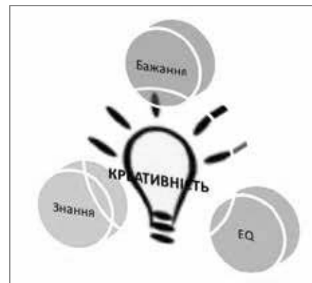
Мал. 3. Схема формування креативності як власної здатності до творчості

що креативність – це здатність до творчості, під час якої, оперуючи знаннями і застосовуючи їх у новому ключі, суб'єкт отримує якісно новий та корисний результат (мал. 3).