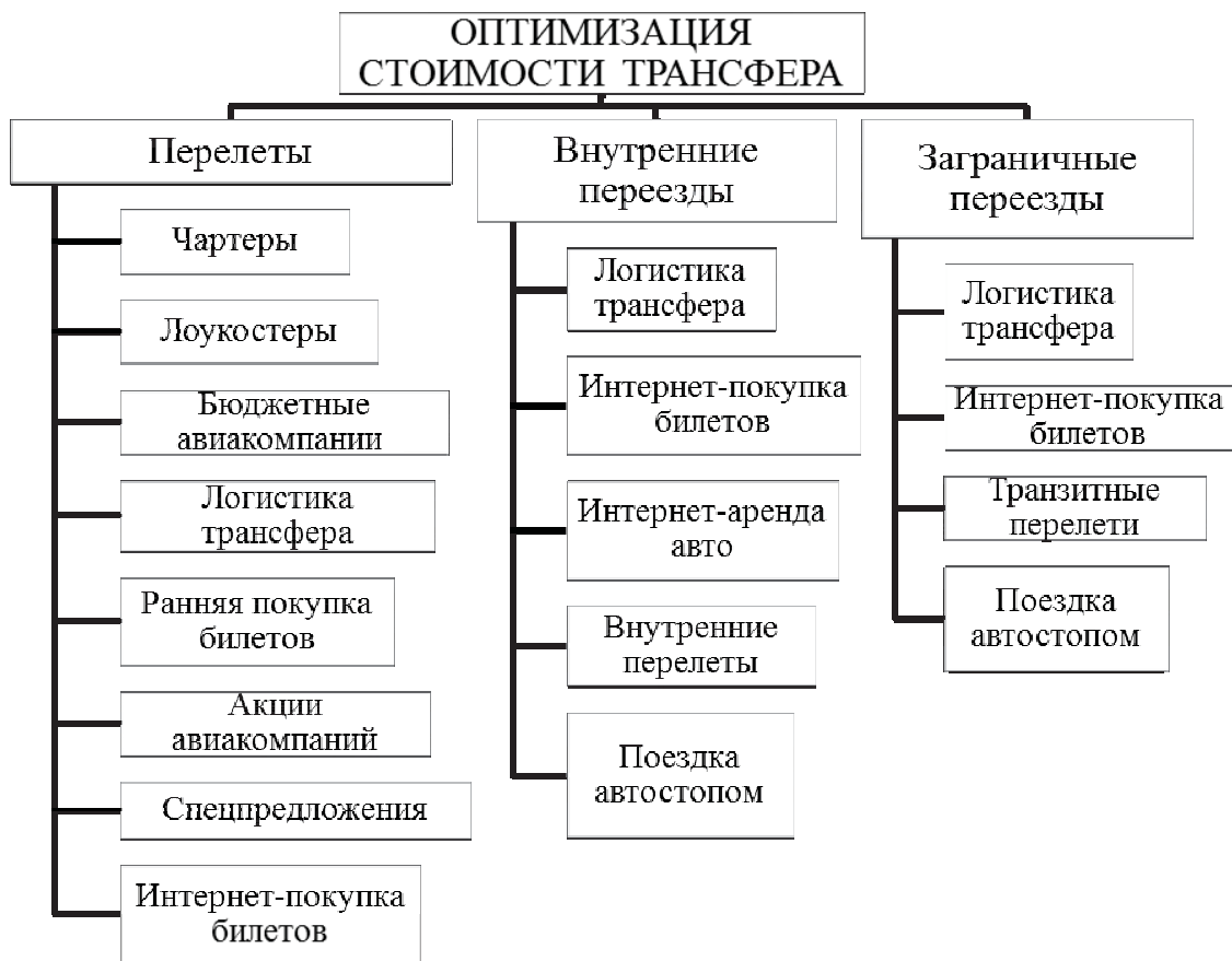
Рис. 3. Основные инструменты снижения стоимости трансфера

Изучение особенностей чартерных рейсов показало, что их могут использовать крупные операторы активных видов туризма, имеют стабильную клиентуру, при условии совпадения сезонности походов и регулярных чартеров. Самостоятельным группам удобнее использовать лоукостер [5].