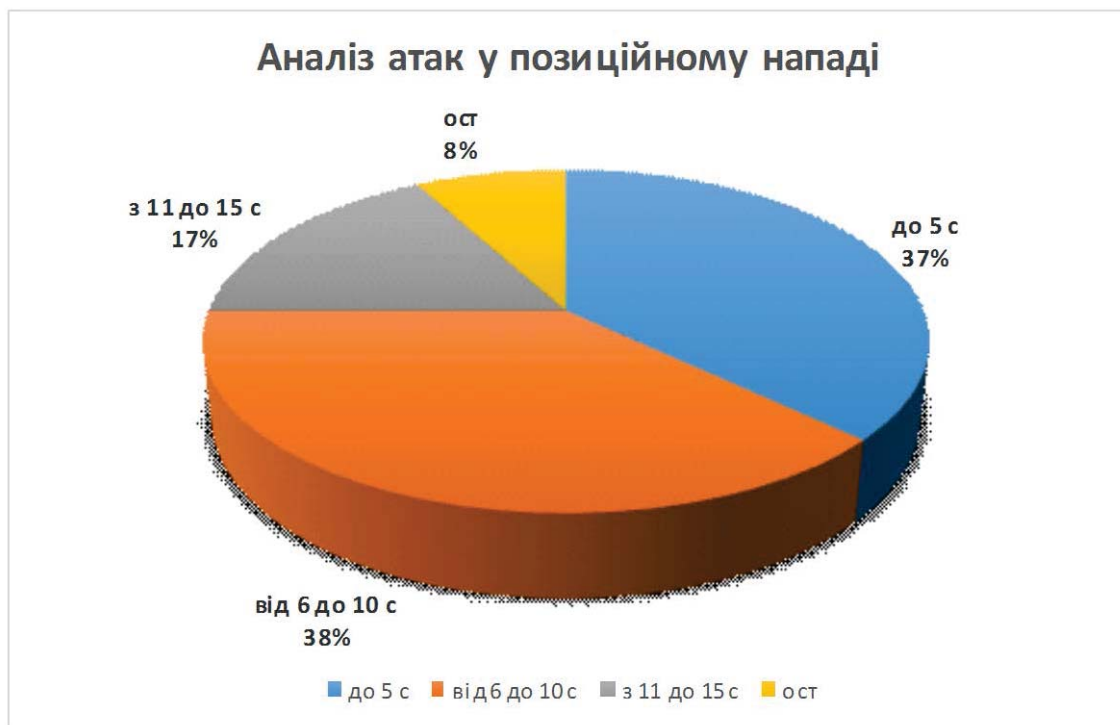
Рис. 1. Аналіз атак у позиційному нападі

Причому, якщо в межах до 5 с проводиться 29,91 атак, або 37%, а від 6 до 10 с 30,02 атак, або 38%, то за період з 11 до 15 с проводиться 13,27 атак, або 17%. У більш віддаленому часовому діапазоні (16–20 с і 21–25 с) загальна кількість атак не перевищує в першому випадку 6,5% (5,16 атак) і в другому – 1,5%, або 1,19 атак, що, на наш погляд, не суттєво для формування позитивного результату гри.