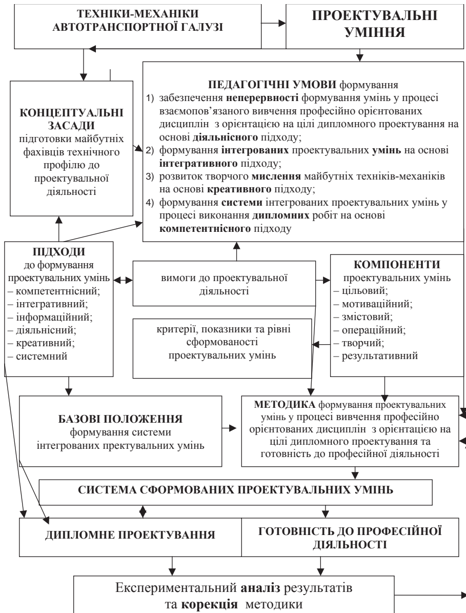
Рис. 2. Загальна модель формування проєктувальних умінь техніків-механіків автотранспортної галузі

Отже, шлях від початкового компонента (ціль) до кінцевого (результат) йде через послідовне формування чотирьох компонентів системи проєктувальних умінь, які виконують роль провідних засобів (мотиваційного, змістового, операційного та творчого). Виділені нами критерії та показники служать вихідними даними для визначення рівнів сформованості вищезазначених компонентів: репродуктивний, продуктивний та рефлексивний. Модель подано на рис. 2.