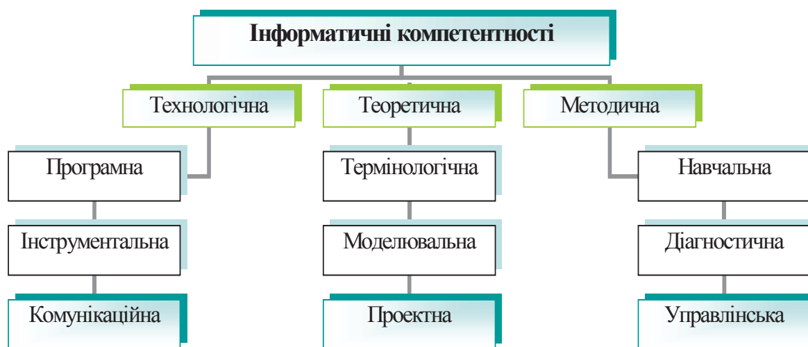
Рис. 2. Система інформатичних компетентностей учителя початкової школи

Аналізуючи різні підходи до визначення сутності компетентності, констатуючи, що вона є складним утворенням, інтегрованим результатом навчання, ми виділили певні види компетентностей у структурі системи інформатичних компетентностей майбутніх учителів початкової ланки освіти відповідно до напрямів їх трьохетапної інформатичної підготовки, що знайшло відображення в схемі (рис. 2).