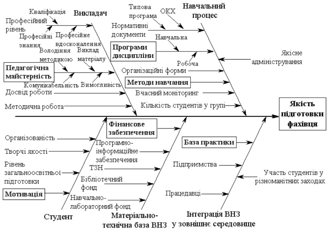
Рис. 1. Причинно-наслідкова діаграма досягнення якості підготовки фахівця

З метою виявлення найсуттєвіших чинників, які впливають на покращення результату професійного навчання студентів, ми скористалися діаграмою Ісікави. Цей інструмент дає змогу визначити причинно-наслідкову залежність між процесом і результатом [9, с. 681]. У результаті була отримана діаграма, яка відображає основні чинники підвищення якості підготовки фахівця в комплексі та ілюструє найзначучі чинники цього впливу (рис. 1).