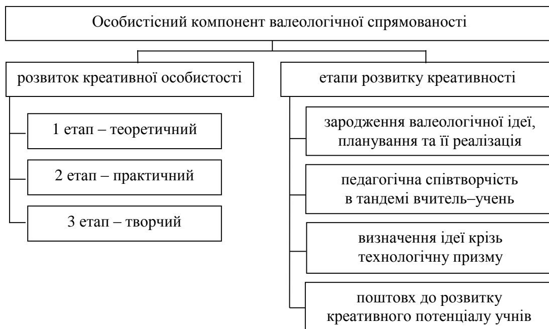
Рис. 2. Структура особистісного компонента валеологічної спрямованості майбутніх фахівців фізичного виховання

готовки, володіння сучасними методиками навчання валеологічної діяльності, наявність валеологічного досвіду тощо. Майбутній фахівець у своїй роботі визначає валеологічну спрямованість у трьох ракурсах: спочатку з точки зору розуміння, засвоєння валеологічної культури й діяльності (як об'єкт валеологічного впливу), згодом у процесі життєдіяльності він вивчає своє середовище крізь призму валеологічної діяльності та прищеплює своєму оточенню валеологічні навички, використовуючи при цьому свою креативність. Структуру особистісного компонента подано на рис. 2.