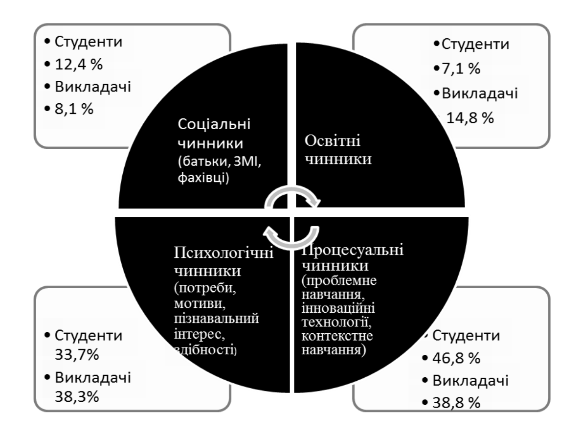
Рис. 1. Вплив чинників на професійну підготовку майбутніх менеджерів організації

Мотиваційний аспект \epsilon рушійною силою людської діяльності, до складу якої входить і навчання. Мотив — це внутрішня рушійна сила, що спонукає людину до діяльності.