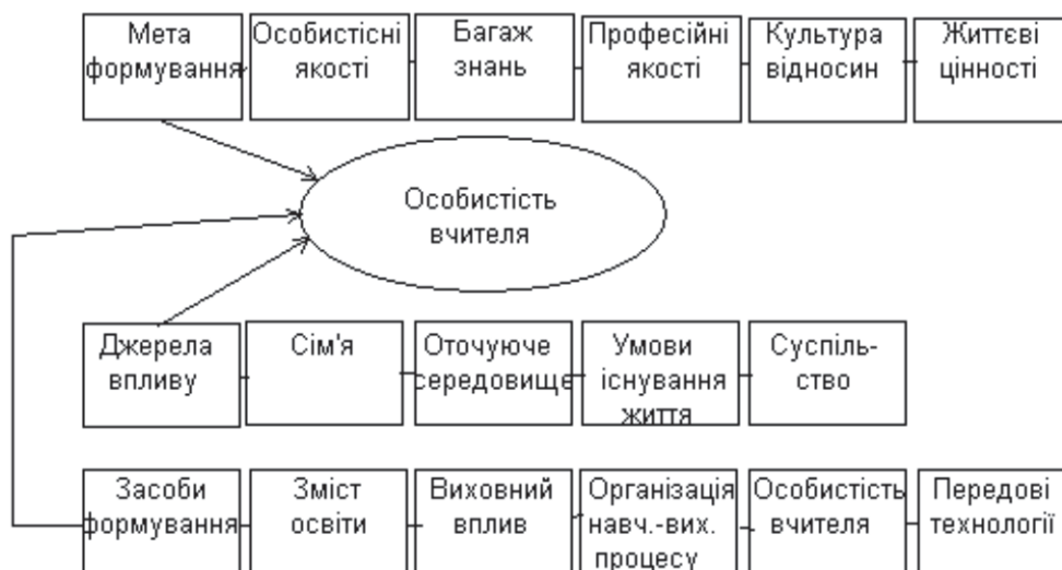
Рис. 2. Модель формування ціннісної сфери особистості вчителя

у професійній діяльності педагога, знаходження шляхів такого впливу, який би спонукав його до переосмислення свого життєвого досвіду, з метою сприяння виникненню нових цінностей, трансформація їх з об'єктивно значущих у суб'єктивно значущі. Такі вимоги посилюють необхідність переосмислення педагогом потреби набуття нових результативних засобів педагогічного впливу, нових форм проектування власної діяльності, використання методів ціннісно-змістового підходу до організації педагогічного процесу [10].