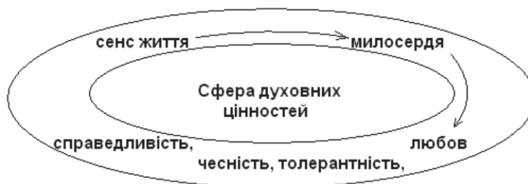
Рис. 1. Коло сфери духовних цінностей

За науковими позиціями І.Д. Беха можна окреслити коло сфери духовних цінностей (рис. 1).